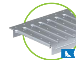
grille à fentes LN 150 LF 8/130, classe A, acier galvanisé