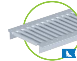
grille à fentes anti-talon LF 5/80, cl. A15 kN