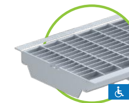
grille caillebotis LN 150 LM 30/10, classe B, acier galvanisé